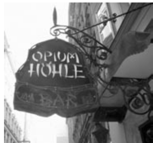
... gesehen im schönen Austria

c/o Eric Rohde Hegelstr. 14 19063 Schwerin