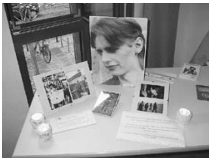
JES Jahrestreffen 2006