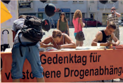
In Stuttgart werden Karten mit Namen beschriftet