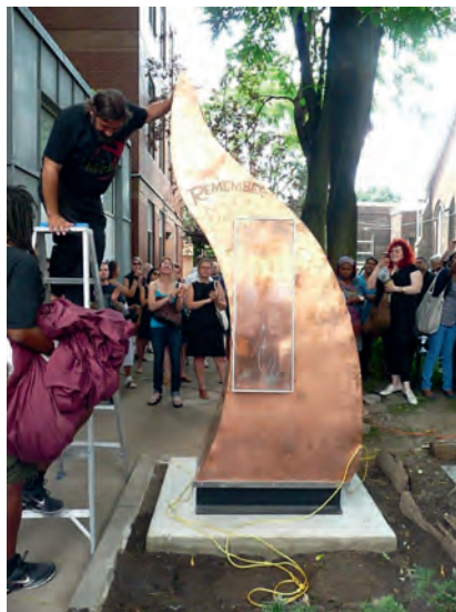
Enthüllung eines Gedenk-Mahnmals in Toronto

Der positive Trend hinsichtlich der Anzahl der teilnehmenden Städte sowie der stärkeren internationalen Ausrichtung des Gedenktags konnte in den letzten beiden Jahren fortgesetzt werden. ■