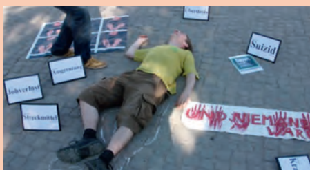
Aktion in Berlin