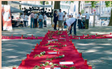
Gedenken in Köln