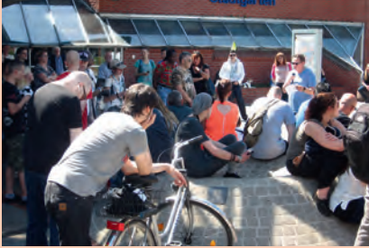
Großes Interesse beim Gedenktag in Dortmund