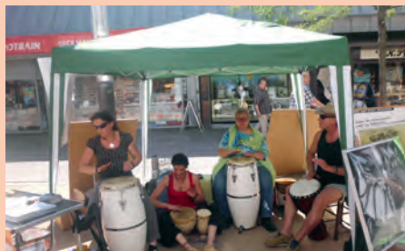
Musikalisches in Lehrte